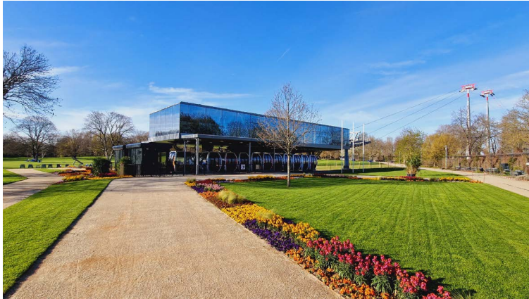
Die Seilbahnstation der BUGA23 im Luisenpark, kurz vor der Eröffnung

Abdruck in Zusammenhang mit der Aussendung honorarfrei.