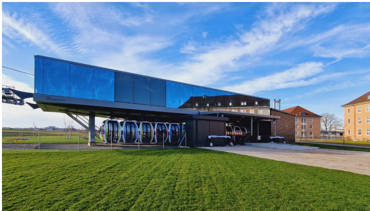
Die Seilbahnstation der BUGA23 im Spinelli Park, kurz vor der Eröffnung