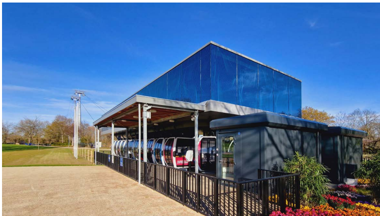
Die Seilbahnstation der BUGA23 im Luisenpark, kurz vor der Eröffnung