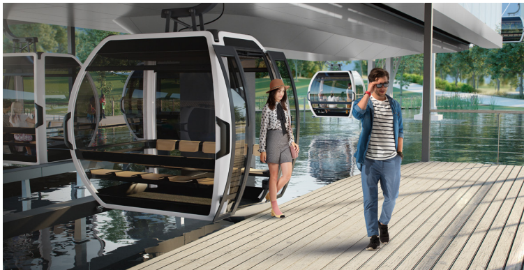
Visualisierung der Seilbahnstation Floriade 2022