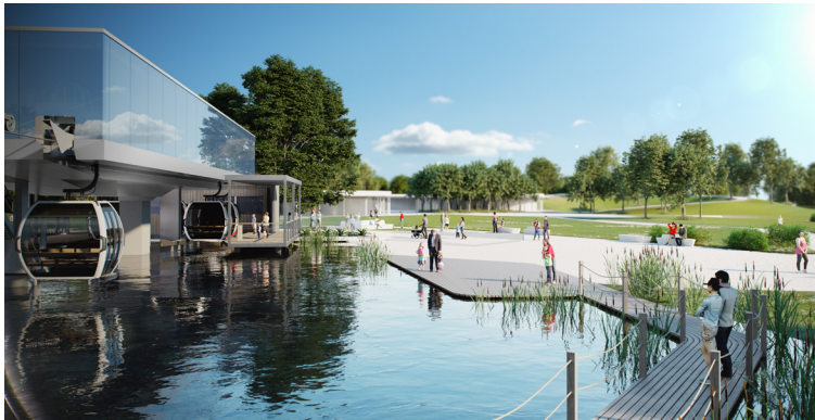
Visualisierung der Seilbahnstation Floriade 2022