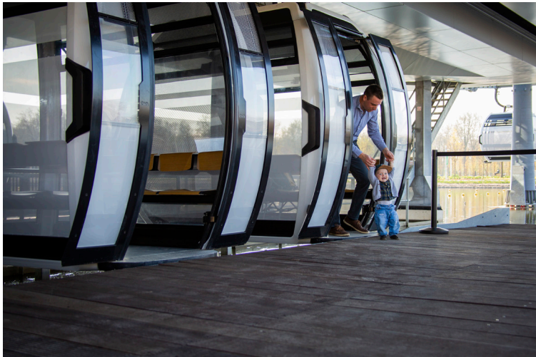
Kleiner Besucher der Floriade 2022 auf seiner wahrscheinlich ersten Seil- bahnfahrt.